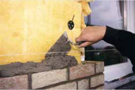
Auflegen des Vormauermörtels

Schwach - / nicht saugende Verblendsteine wie Klinker, Beton- oder Keramiksteine stellen andere Anforderungen an Vormauermörtel. Während herkömmliche Mörtel leicht zum Wässern neigen, sind Sakret Vormauermörtel speziell für diese Steinart rezeptiert.