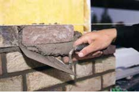
Abstreifen des ausquellenden Mörtels